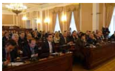
Mezinárodní konference: „Lisabonská smlouva a budoucnost evropské bezpečnostní politiky“