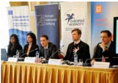
Mezinárodní konference „Na cestě k bezpečnější Evropě“