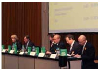
Mezinárodní konference „Finanční krize, měnové a fiskální problémy“