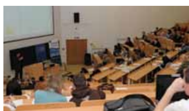
Konference „Východiska z krize“