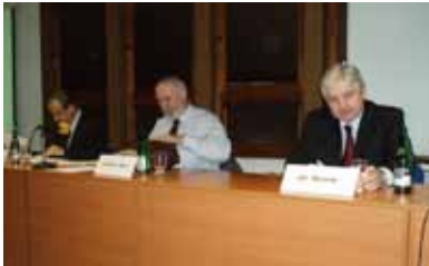
Panelová diskuse „Důchodová reforma v ČR: spása anebo zmar?“