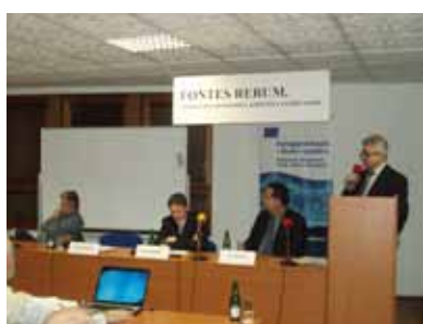
Panelová diskuse „Strategie fiskální konsolidace anebo exit strategie?“