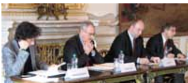
Mezinárodní konference „Sociální soudržnost a integrace v Evropě“