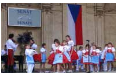
Evropský den 2010