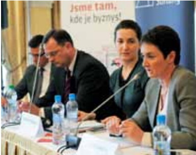
Ondřej Liška, Petr Nečas, Kateřina Šafaříková, Jana Hybášková